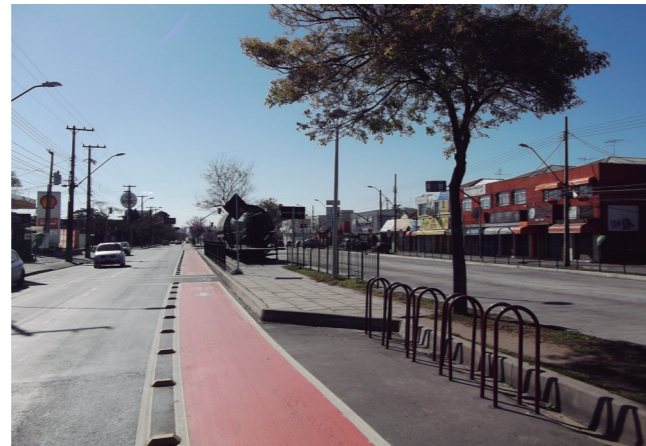
写真2と3 クリチバ市役所は、BRT幹線の再編を行っており、幹線に沿って自転車レーンを敷設している。さらにいわゆる地下鉄駅の近くには、自転車道を設置している。

If, on the one hand, all the land along the railroads must be kept unoccupied for safety reasons, on the other hand, this area remains as an empty space in the very core of the city. The municipality decided to use this unoccupied area to build bicycle paths, which reach some cities in the metropolitan area.