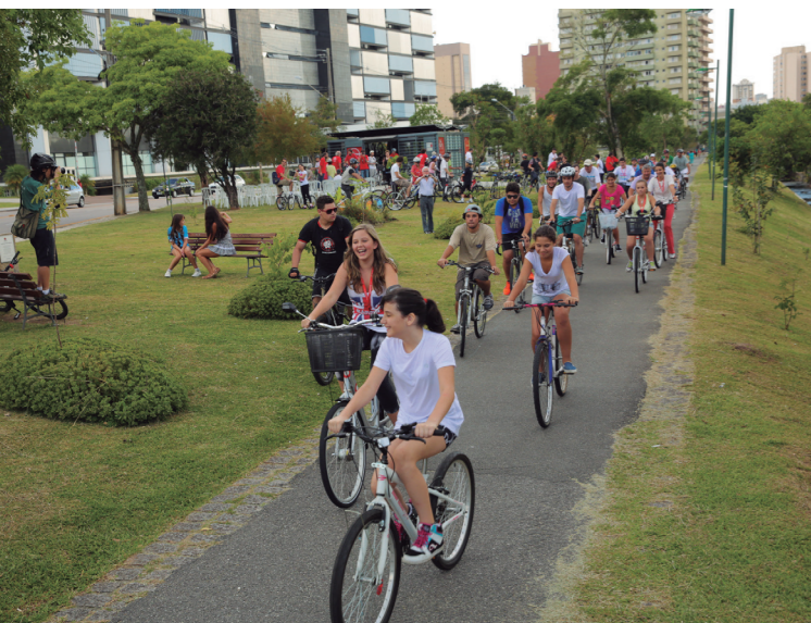
Figures 8 and 9: The bike share system

In 2013, a new municipal government took place. In his inauguration day, the new Mayor rode on bicycle to the City Hall. Nine months later, the Municipality presented the main guidelines of its plans to enhance the modal partition of bicycles in the city. In