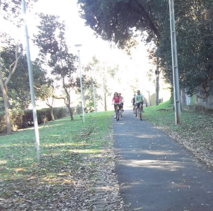
Figures 6 and 7: In the 1980s the city implemented its most used bike paths network along urban rivers, linking the municipal parks.