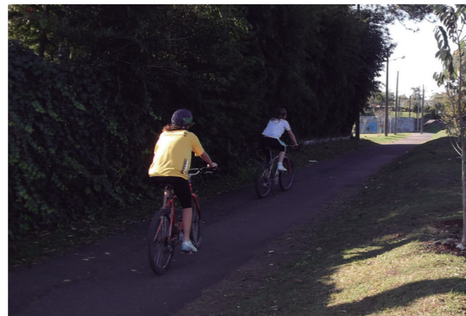
Figure 4 and 5: In the 1980s Curitiba launched its bike routes project. Today the bike routes network has 120km. In its first phase, the municipality implemented the bike paths in areas with no other possible use, for example, as along the railways.