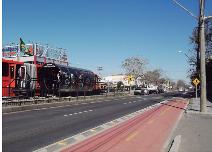
Figures 2 and 3: The municipality is remodeling its BRT corridors, and is implementing bike lanes along some of them, and installing bike racks near by the so called tube stations.