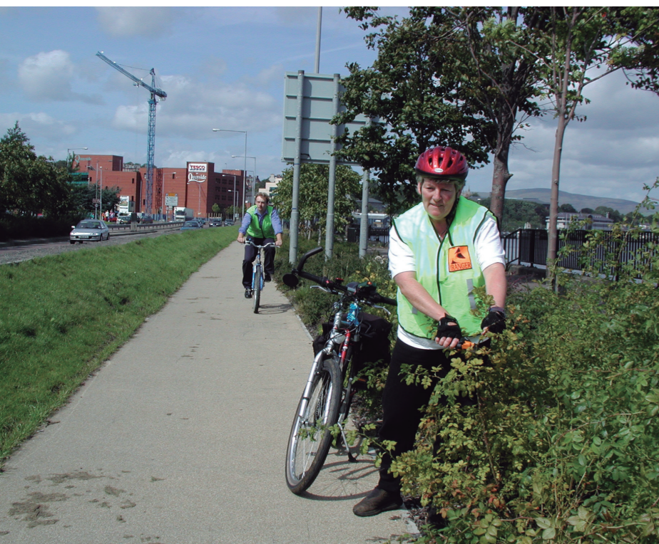
Volunteer rangers undertake minor route maintenance

As one ranger says “we are especially keen to take the Sustrans message into workplaces since most work journeys are so short and could easily be made by bike or even on foot. But I will also be doing my bit to make sure the routes are well signed and looked