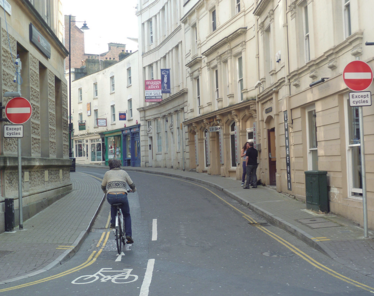
Improved permeability: contraflow cycling in a one-way street, Bristol