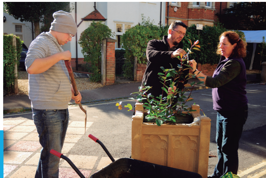
Effective public engagement increases the sense of community ownership of a route

■ 主要な観光スポットの欧州議会、目に付く駐輪場