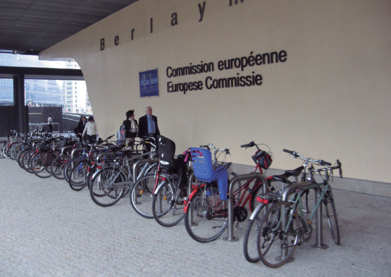
Raising the profile: highly visible cycle parking at key attractors, European Parliament

■ 主要な観光スポットの欧州議会、目に付く駐輪場