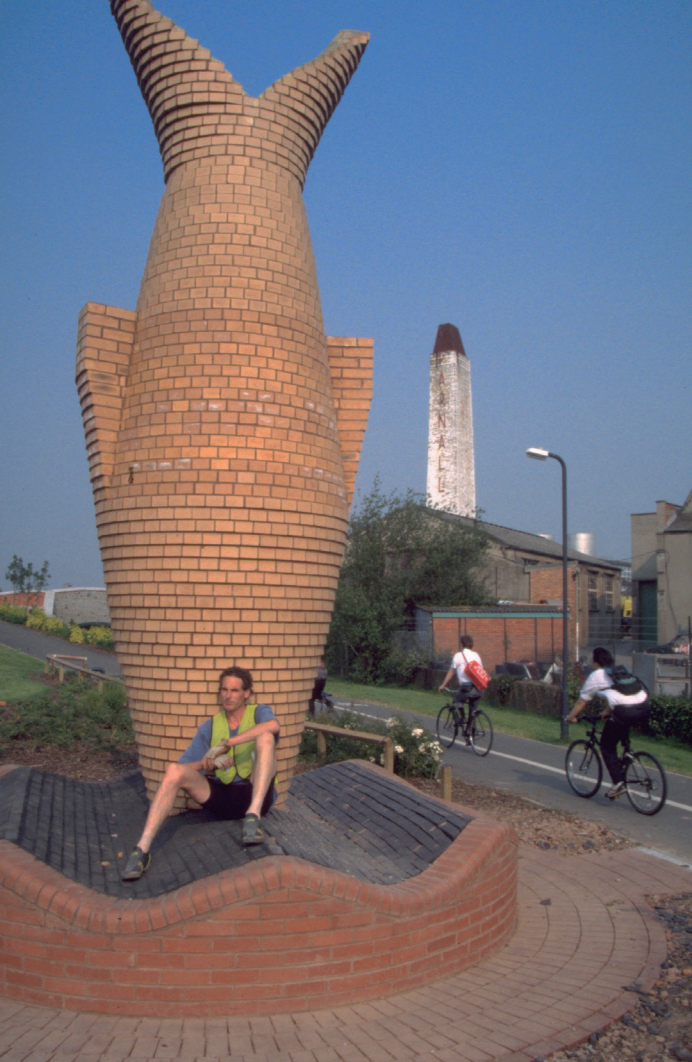
A "travelling landscape": public art can enhance the experience of using a route

Local cycle network development took a step forward when, in 2005, the government established Cycling England, a non-governmental public body set up to support cycling with the aim of getting more people cycling, more safely, more often. Between 2005 and 2011, Cycling England funded a programme of Cycling Demonstration Towns. The underlying principle of this programme was to demonstrate that, with funding levels of between £10 and £20 per head per year – not untypical in countries with high levels of cycling – substantial sustained year on year growth in levels of cycling could be achieved. Monitoring of the programme has shown encouraging results, with growth rates comparable to other places that have achieved large increases in cycling.