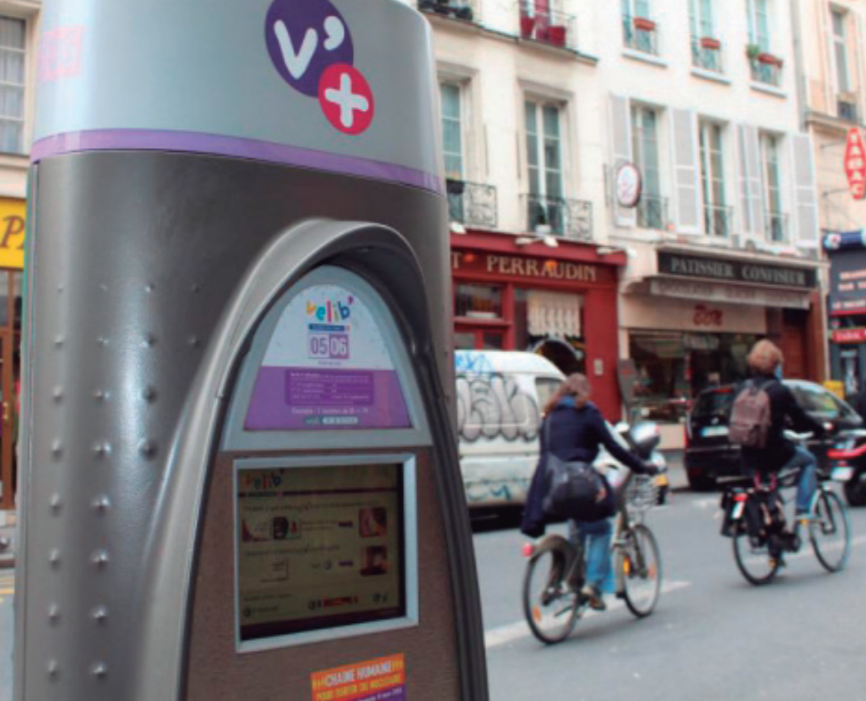
A Vélib' station in a Paris street.

sustainable development. The first years of his mandate were guided by the principle of the improved sharing of public space between its different users, allowing the spectacular increase in the number of cycling facilities and thus providing the essential foundations for the implementation of an innovative, large-scale bike rental system. It was in this context that the Vélib' service was launched on 15 July 2007. This marked a major step for cycling policy and more broadly speaking for urban mobility in Paris and had major repercussions on the image of the French capital.