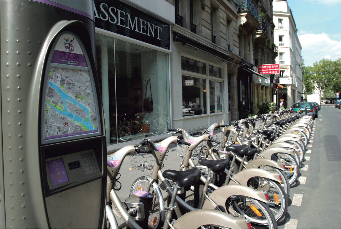
A V+ station : gain 15 extra free minutes each time you return your bike to one of the V+ elevated stations.

It was also necessary to learn how to manage and regulate the number of bikes in a station. To solve the problem of stations which were empty or congested at the start of the service, the operator JC Decaux had to put in place the technical means and teams to resupply empty stations and to remove and repair damaged or broken bikes at any time of the day or night.