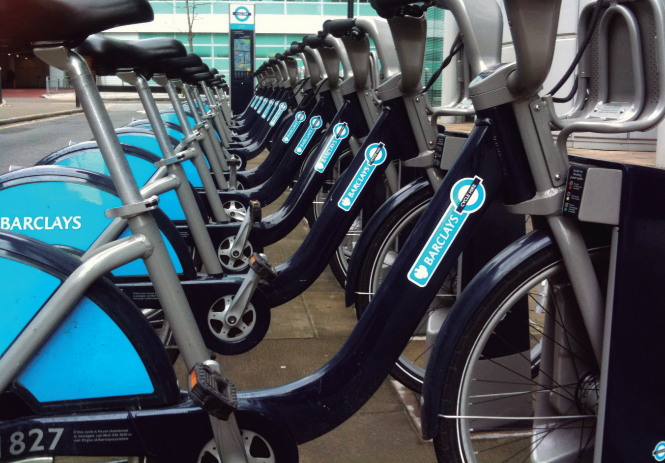
Extent of London bikes

service delegation contract. However, they all have the advantage for the authorities of having a perfect knowledge of what the service costs. Barclays Cycle Hire in London, for example, is part of this second category, with a governance-type financing system, with no recourse to advertising revenue but with recourse to sponsoring.