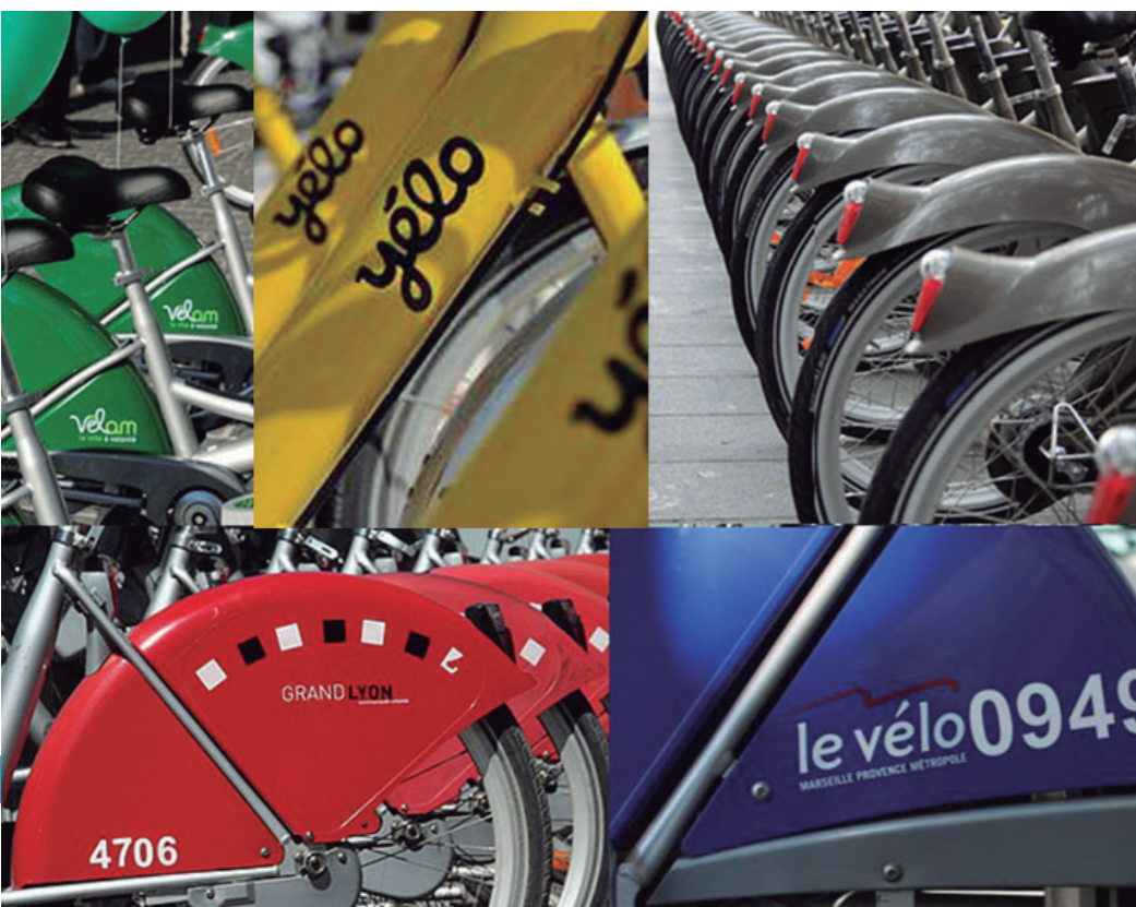
Different self-service bikes

The growth of self-service bike rental systems is one of the most noticeable elements of urban development witnessed in a number of large cities over the last decade. It has not only been an environmental challenge, a way of finally turning this universal ambition of adapting the city to sustainable development into reality; there has also been an urban evolution, or even revolution at stake. Bikes are a great way of travelling, just like the metro, the bus or the car, and are one of the keys to rethinking urban mobility.